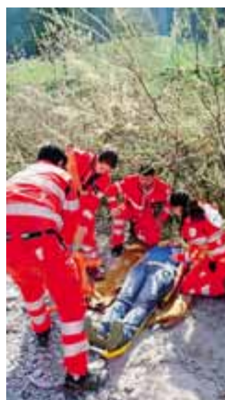
Tanti i volontari coordinati dal 118

Dopo: infermierizzata a Ponte San Pietro (1° marzo), automedica a Capriate (1° marzo), di base 24 ore a Bonate Sotto (1° marzo), di base 24 ore a Zingonia (1° marzo).